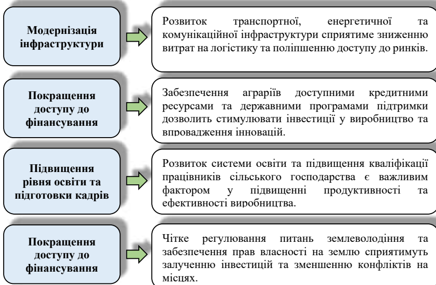
Рис. 2. Можливості підвищення ефективності використання соціально-економічного потенціалу