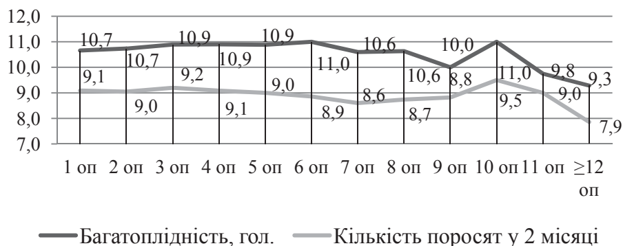
Рис. 1. Динаміка багатоплідності та кількості поросят у 2 місяці, гол.

порядкового номеру опоросу на великоплідність, котра була на рівні 1,1 кг, при цьому рівень її мінливості був низьким (4,4...8,4 %). З віком збільшується коефіцієнт варіації, через присутність як рекордних так і досить низьких показників.